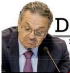
Octavio Romero, titular de Pemex