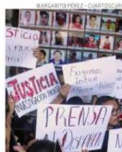
Protestas en Cuernavaca por el asesinato de Figueroa.

periodista morelense, conductor y productor del programa "Acá en el Show", que se transmite por plataformas digitales, se registró la mañana de este 26 de abril, luego de haber dejado a sus hijos en la escuela, de donde no se volvió a tener noticias de él, sino hasta horas después, cuando a través de su teléfono celular llamaron a su familia para exigir un rescate para liberarlo. PAG 8