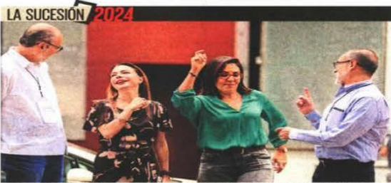
Consejeros electorales, durante la conferencia y recorrido para medios en el foro de los Estudios Churubusco donde se realizará el debate de los candidatos.

Año 107, Número 38,868 CDMX 64 pags. 9 771870 156012 38868