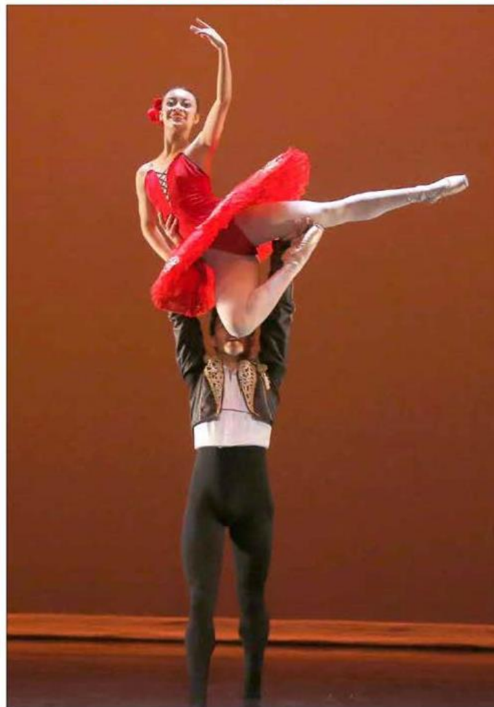
▲ En escenarios del Cenart (en la imagen) y la UNAM, miles de personas se congregaron ayer para celebrar el Día Internacional de la Danza,