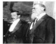
SUCESIÓN PRESIDENCIAL 017-2024

Desde hoy y hasta el 2 de octubre, el Periódico de la Vida Nacional publicará las tomas de protesta de los presidentes que ha tenido el país. Iniciamos con Carranza y terminaremos con quien gane el 2 de junio. / 8