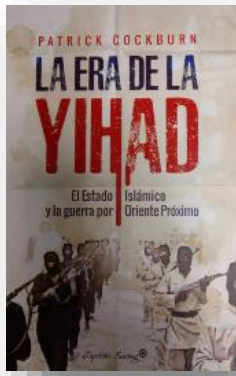
Ilustración 17 portada de la obra