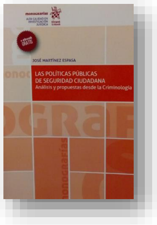
Ilustración 19 portada de la obra