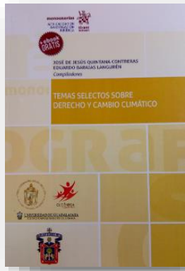
Ilustración 23 portada de la obra