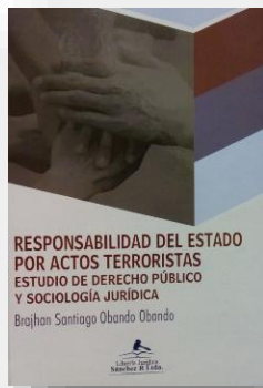
Ilustración 20 portada de la obra