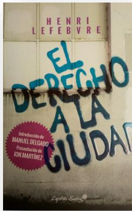
Ilustración 21 portada de la obra