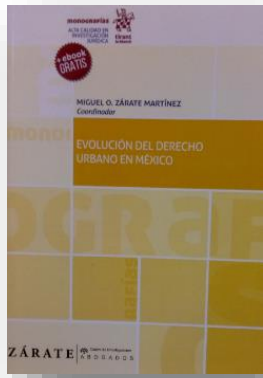
Ilustración 22 portada de la obra