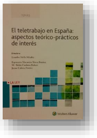
Ilustración 34 portada de la obra