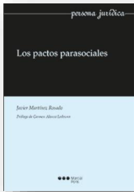
Ilustración 33 portada de la obra