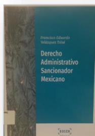
Ilustración 8 portada de la obra