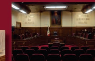
Sala de Plenos de la Suprema Corte de Justicia de la Nación