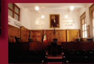
Sala de Sesiones Públicas de la Segunda Sala

Esta publicación es responsabilidad exclusiva de la Suprema Corte de Justicia de la Nación, así como el origen de las fotografías. Su edición estuvo al cuidado de la Dirección General de la Coordinación de Compilación y Sistematización de Tesis.