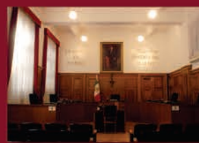
Sala de Sesiones Públicas de la Primera Sala