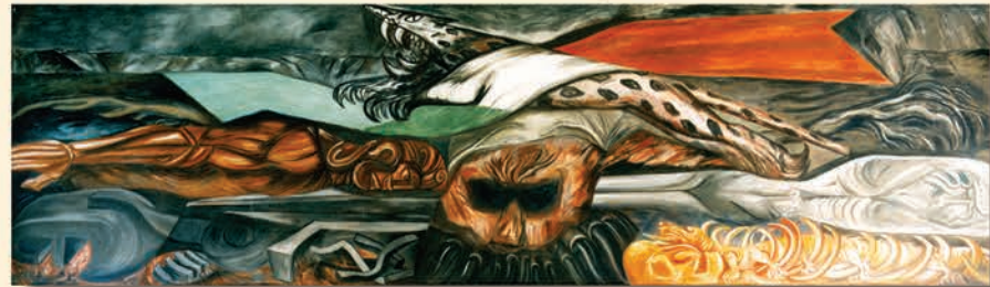
Las riquezas nacionales

Las pinturas en los tableros norte y sur, de forma apaisada, se ejecutaron bajo el tema La justicia (1941), ambas divididas en dos secciones: "... la justicia metafísica, fulminando a los malvados, y la justicia de los hombres, castigándolos ...".