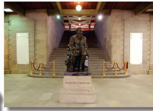
Vestíbulo de entrada al edificio