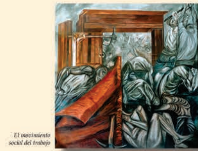
El movimiento social del trabajo

En el muro sobre la escalera, Orozco pintó El movimiento social del trabajo (1941), vigorosa composición plástica en la que el problema de siempre reaparece: el hombre –en este caso el obrero– sucumbiendo, levantándose, unificándose y trabajando arduamente. Destaca una bandera roja, símbolo de las luchas de los obreros y del ideal, y la mano que empuña un zapapico, que bien puede pertenecer a aquel medio hombre, medio simio, que se levanta en actitud demoledora, en ineludible presencia, para proclamar justicia.