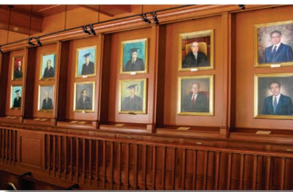
Galería de Presidentes de la Suprema Corte de Justicia de la Nación

Además de estas imágenes, en la Galería se exhiben ediciones facsimilares de las Constituciones de 1824