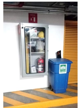
Ejemplos gráficos de condiciones de almacenamiento de los extintores en las instalaciones de la SCJN.