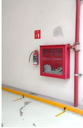
Ejemplo gráfico de extintor en área semiabierta