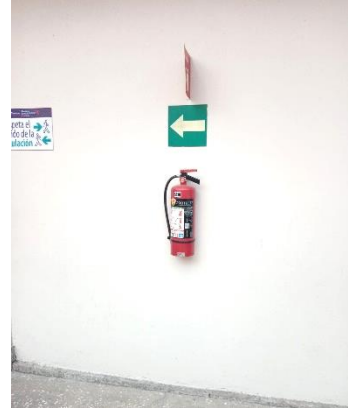
Ejemplo gráfico de extintor al exterior.

Dentro de las instalaciones no existen áreas cuyas condiciones atmosféricas, actividades o configuración, representen un factor ambiental que potencialice el desgaste del conjunto del extintor o de sus componentes.