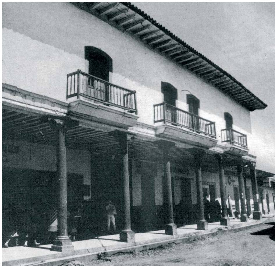
Fachada principal del edificio que albergó al Primer Supremo Tribunal de Justicia de la América Mexicana, en la Villa de Ario, Intendencia de Valladolid de Michoacán.