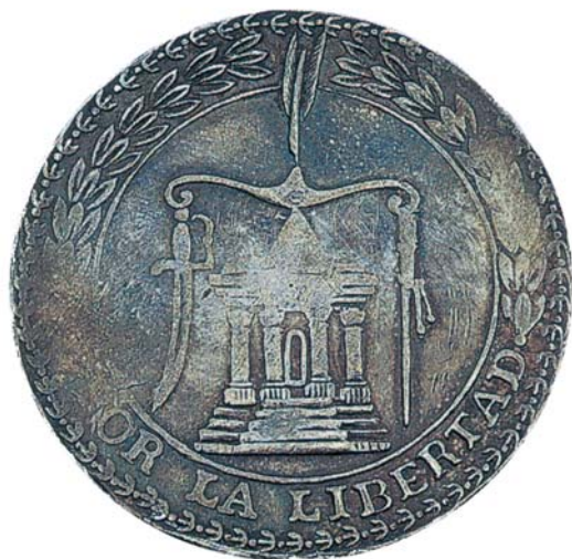
En 1814 se acuñó una Medalla que conmemora el establecimiento de los tres Poderes públicos, de acuerdo con la Constitución de Apatzingán.

Lamentablemente, su estancia en esta villa fue breve, pues a partir del sábado 6 de mayo de 1815 el Tribunal se dispersó a causa de la llegada del ejército realista, al mando de Agustín de Iturbide. Poco después se restableció temporalmente en Puruarán, Uruapan, Huetamo, Tlalchapa y Tehuacán. En esta última población, el coronel Manuel de Mier y Terán disolvió las tres corporaciones del gobierno insurgente, el 15 de diciembre de ese mismo año. 8