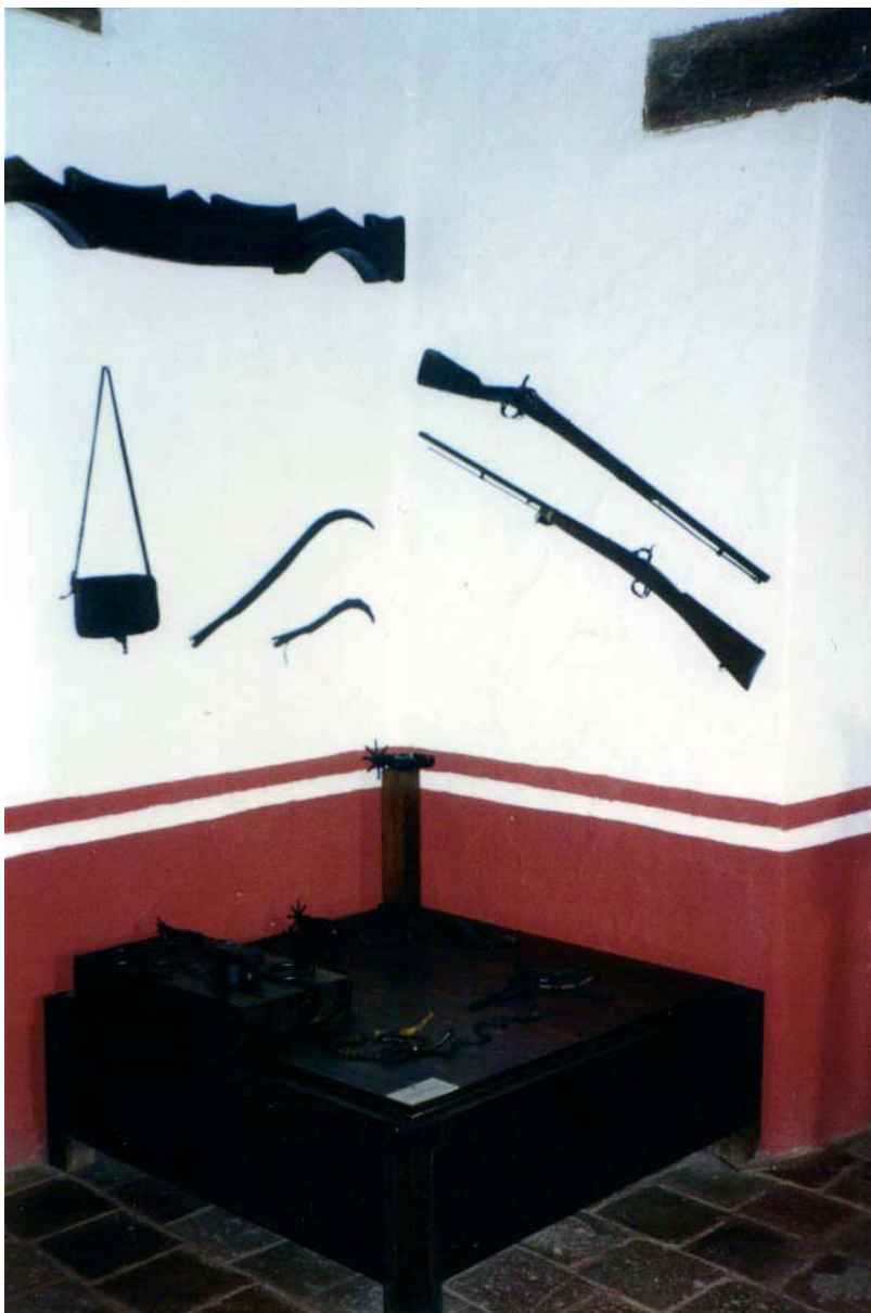
El Museo fue inaugurado el 7 de marzo de 1985, con motivo de la celebración del CLXX Aniversario de la instalación del Supremo Tribunal de Justicia en Ario.