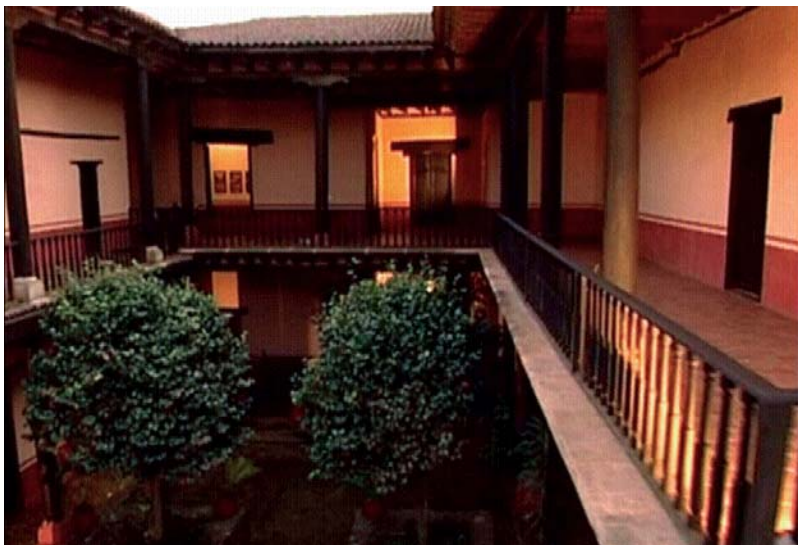
Los corredores de la planta alta circundan el tradicional patio del histórico inmueble.