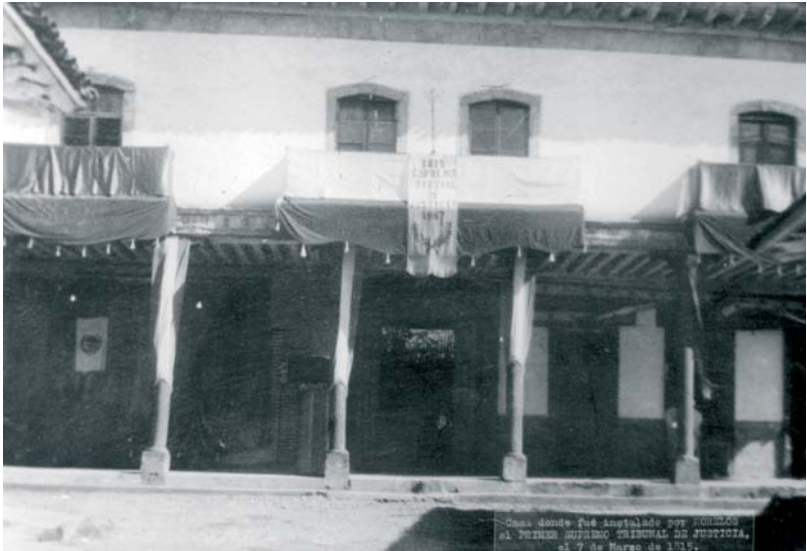
El 7 de marzo de 1967 se realizó por primera vez una ceremonia para celebrar la instalación del Supremo Tribunal de Justicia en Ario de Rosales.