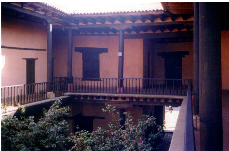
El antiguo recinto del Supremo Tribunal de Justicia de la América Mexicana es considerado con orgullo por los arienses, patrimonio histórico y arquitectónico de la localidad.