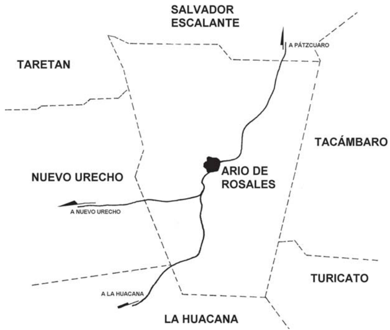
Ario de Rosales y municipios michoacanos con los que colinda.