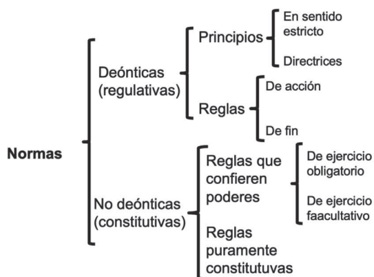
Cuadro 2. Reglas y principios

o normas programáticas —mandatos que establecen la obligación de procurar obtener objetivos económicos, sociales, etcétera, fijados de manera muy genérica—. 21 Existe cierto paralelismo entre los principios en sentido estricto y las reglas de acción, por un lado; y las directrices y las reglas de fin, por otro. El siguiente cuadro muestra esta muy conocida clasificación: