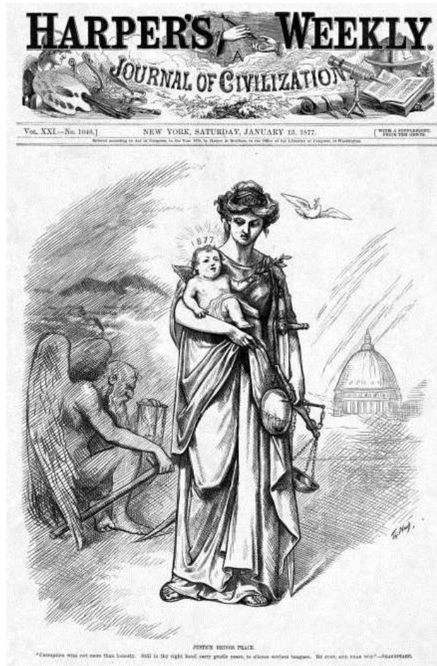
Cartón de Thomas Nast, publicado en Harper's Weekly el 13 de enero de 1877, a propósito del año nuevo.