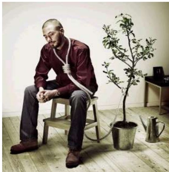
Era parte de un proyecto universitario