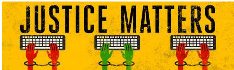
Caso Zone9 Bloggers