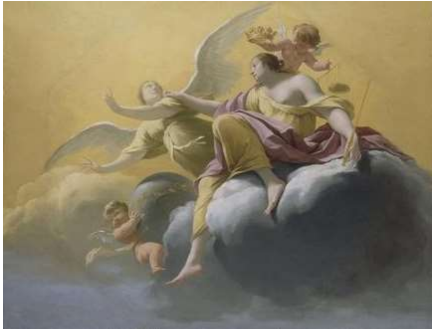
Obra de Simon Vouet (1590-1649)