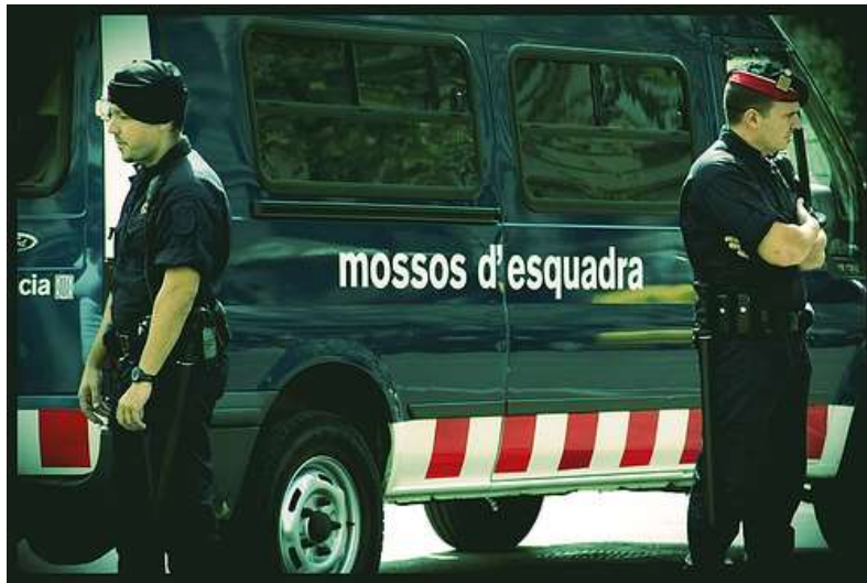
Les faltó al respeto

actitud". Además, ha valorado el testimonio de la juez decano de Martorell, que aunque no presencié los hechos manifestó haber constatado que esa manera de proceder era "habitual en la actora". Además, la secretaria de su juzgado ratificó como "cierto" uno de los incidentes.