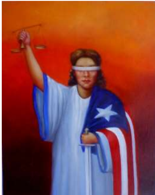
Cuadro de Felipe Oduardo.