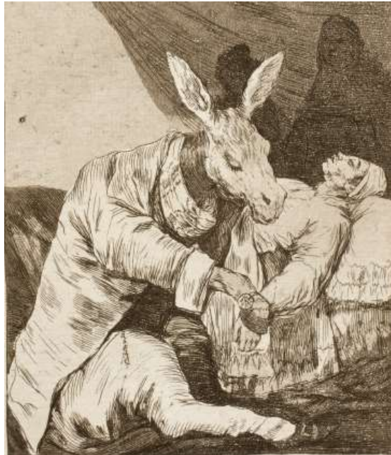
Tendría que pagar 5,000 euros