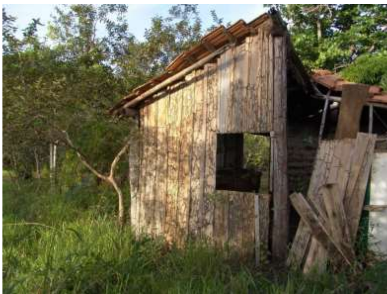
Tampoco se alcanzaba a ver el campo de golf