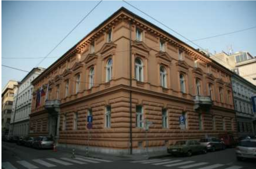
Eslovenia, Suprema Corte