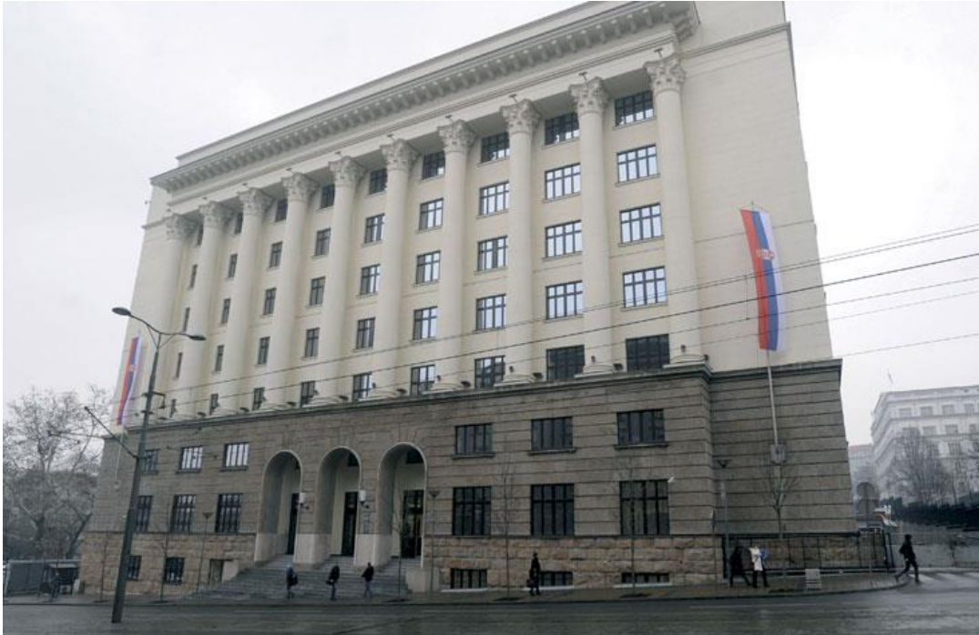
República de Serbia, Suprema Corte