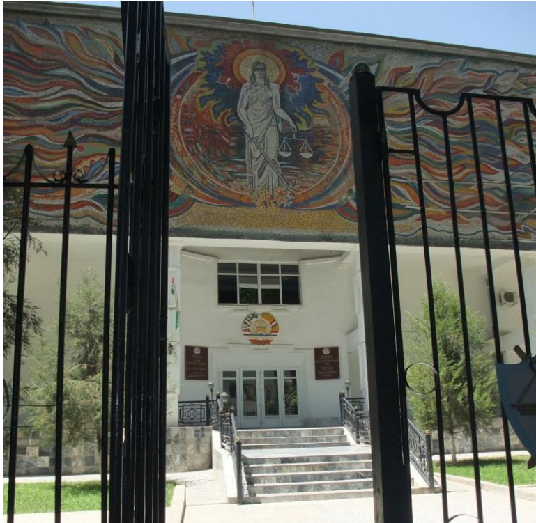
Tayikistán, Corte Constitucional