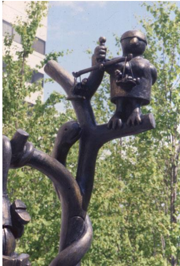
Tom Otterness, Tree of Knowledge , Michigan, EEUU.