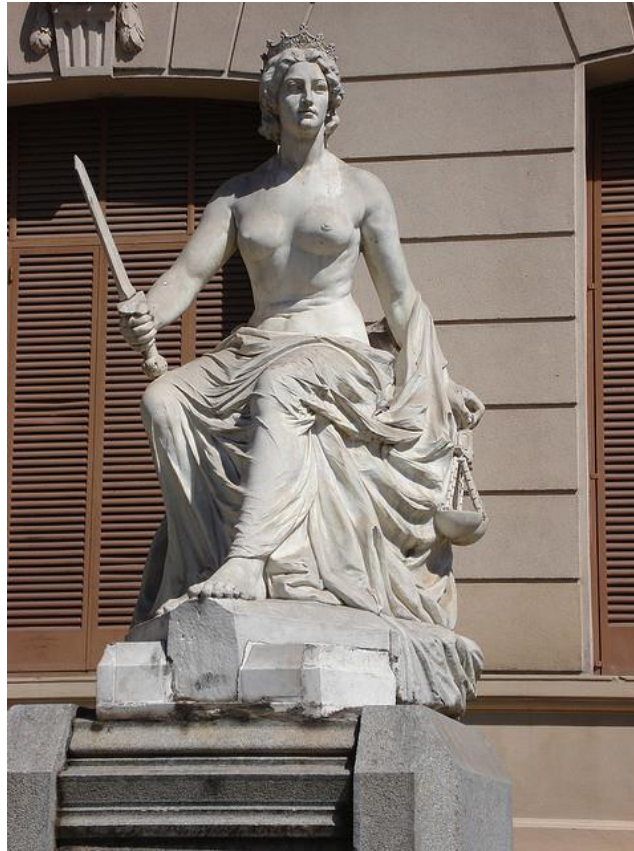
La Justicia, Casa de Gobierno, Jujuy, Argentina.