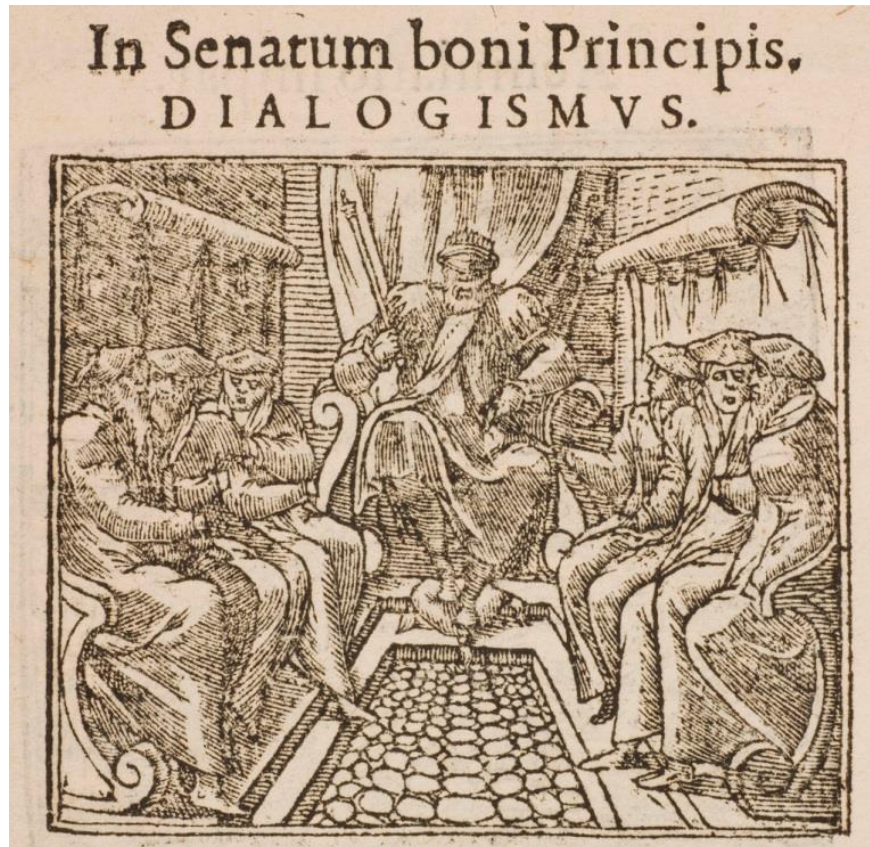
Andrea Alciato, Emblematum libellus , Edición de 1582, Basilea.