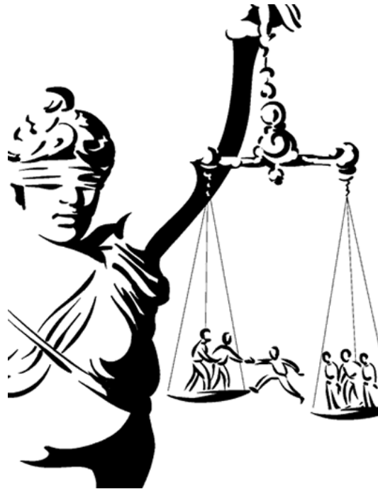
Ilustración de Sam Oliver