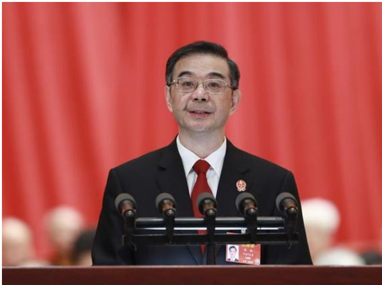
Zhou Qiang, presidente de la Suprema Corte.