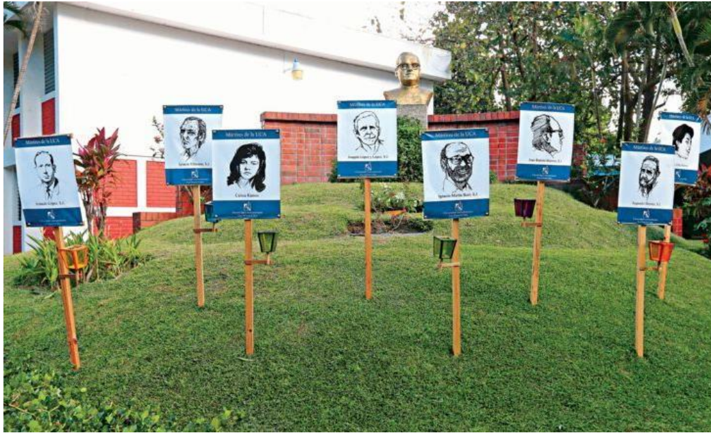
Reapertura del caso