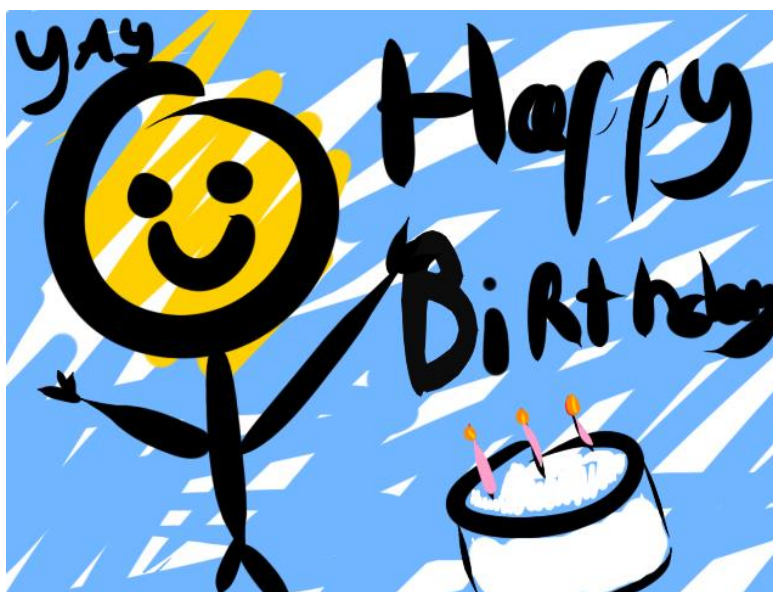
Es de dominio público