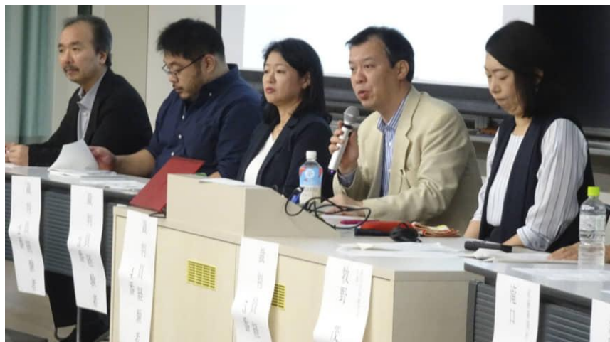
Jueces “legos” reflexionan sobre su labor