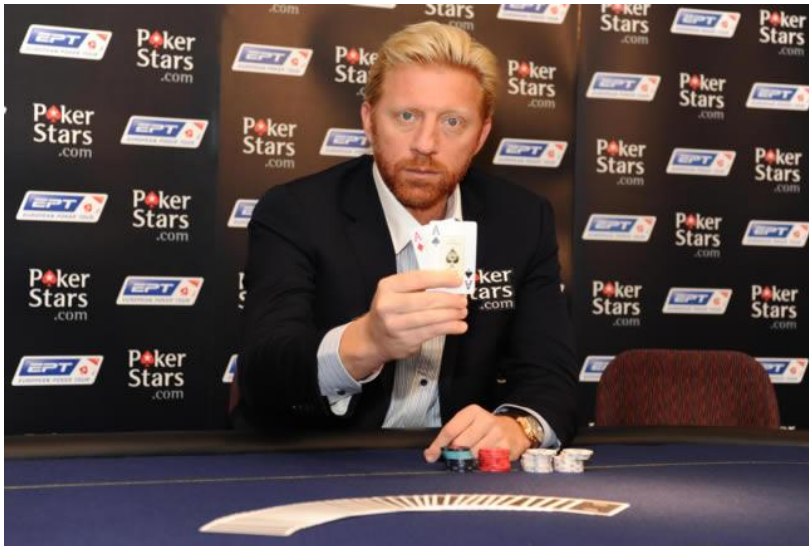
No en Eilat

Elaboración: Dr. Alejandro Anaya Huertas