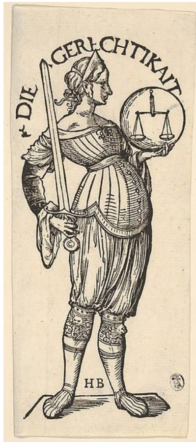
Obra de Hans Burgkmair (aprox. 1500)