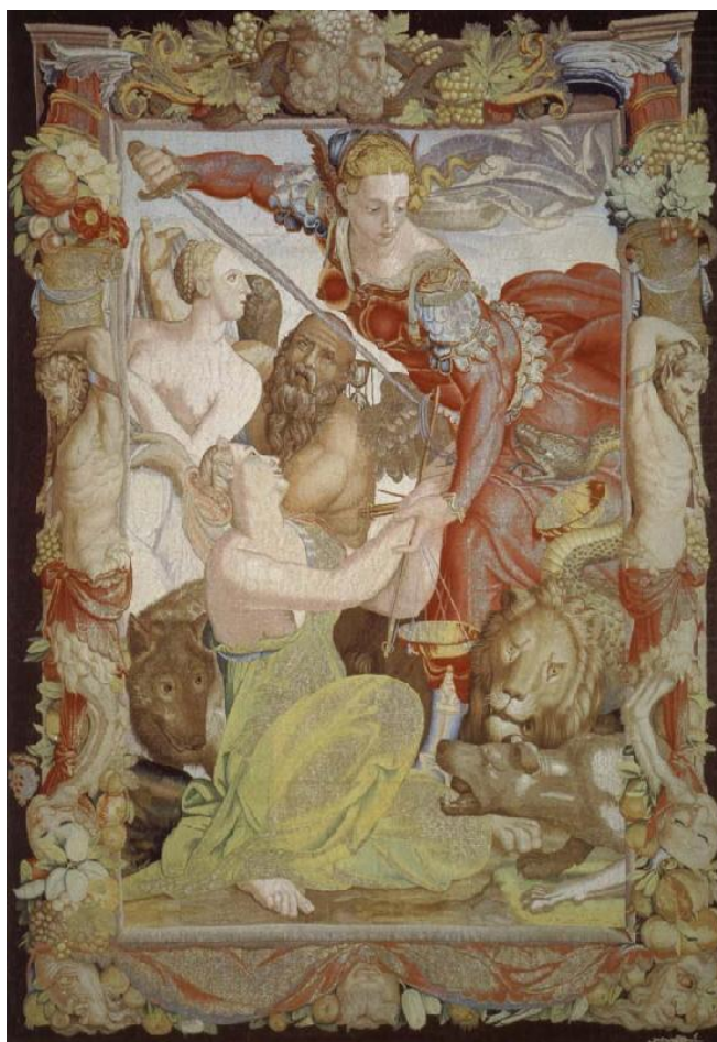
Oleo de Agnolo Bronzino (1503-1572)