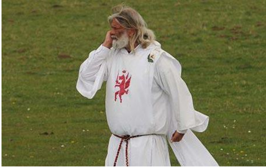
El Rey Arturo

Elaboración: Dr. Alejandro Anaya Huertas