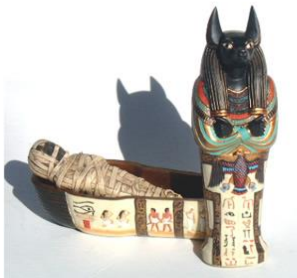
La familia esta desencantada pero no apelará

Elaboración: Dr. Alejandro Anaya Huertas