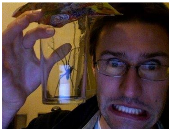
Era fauna protegida