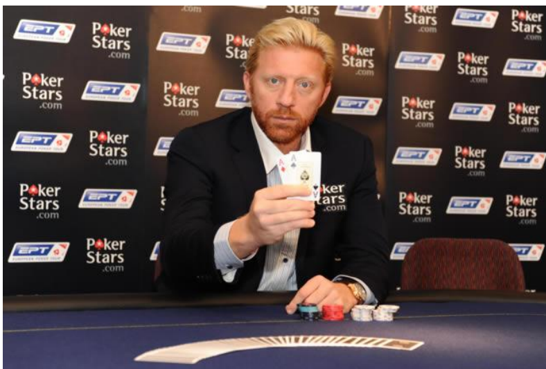
No en Eilat

de azar, para lo que presentaron un estudio del profesor Ehud Lehrer, de la Escuela de Matemáticas de la Universidad de Tel Aviv, en el que se defiende que la suerte no basta para ganar en una mesa de póquer. Sobre este fundamento, los jugadores consideran que el conocido juego de cartas no debe estar sometido a la Ley de Apuestas de Israel (de 1977), que prohíbe todos los juegos de azar y apuestas a excepción de la Lotería Nacional y los autorizados por la Comisión Israelí de Juegos Deportivos.