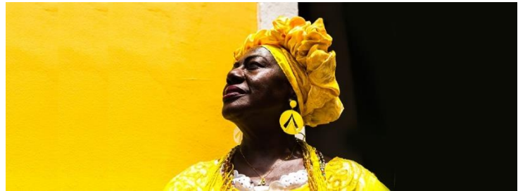
Día Mundial de la Cultura Africana y de los Afrodescendientes