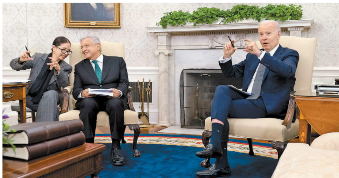
Andrés Manuel López Obrador propuso al presidente estadounidense un plan de cinco puntos para atender juntos.

Carlos Puig "López Obrador hizo lo correcto en EU, pero no pasará nada" - P. 2