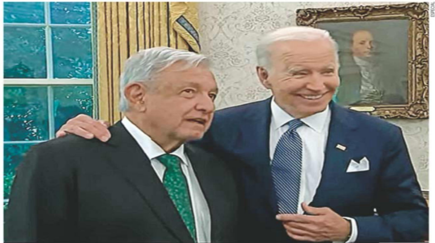
Los presidentes de México, Andrés Manuel López Obrador, y de Estados Unidos, Joe Biden, en la reunión en la Casa Blanca, en la que pactaron proyectos que beneficien a los migrantes y de infraestructura en la frontera común.