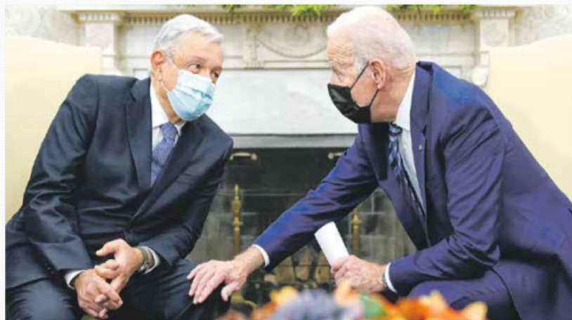
SALÓN OVAL. El presidente López Obrador fue recibido en la Casa Blanca por Joe Biden como "amigo y socio".