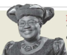
Ngozi Okonjo-Iweala "Sin solución a la vista, crisis en las cadenas de suministro" - P. 20 Y 21