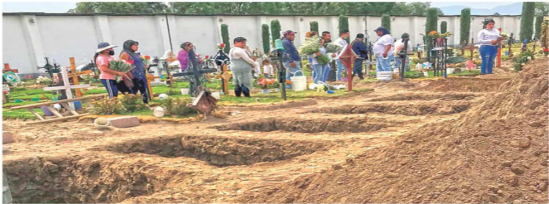
Poca gente acudió al entierro, en el cementerio de Xahuento, de siete de las ocho personas masacradas en Tultepec.

La Fiscalía del Edomex dijo que mantiene una intensa investigación para dar con los homicidas.