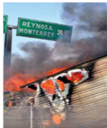
Tres camiones fueron incendiados ayer en Reynosa.

Sin embargo, el republicano sólo retiró las inspecciones, cuya minuciosidad busca evitar el cruce de migrantes ocultos en camiones, en el Puente Internacional Colombia, tras pactarlo con el gobernador de Nuevo León, Samuel García.