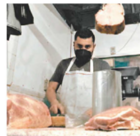
Correa vs. Grupo X. E. CASTAÑEDA

En Ciudad Hidalgo, Michoacán, la vigilia 2022 llegó antes de tiempo por la guerra entre cárteles del narcotráfico. PÁG. 10