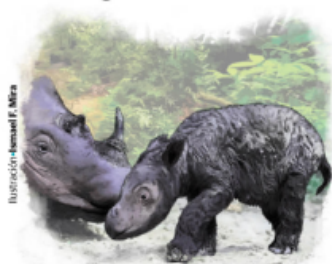
Ilustración: Remon F. Mira