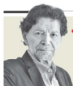
Jorge Zepeda Patterson "El milagro depende del PRI, con el que nunca se sabe" - P. 12