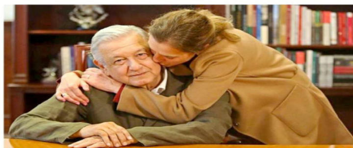
Beatriz Gutiérrez Müller, esposa del Presidente, compartió en redes esta imagen tomada ayer.

El texto está firmado por Granholm, la Secretaria de Comercio, Gina Raimondo, y la Representante Comercial, Katherine Tai.