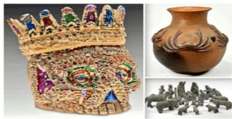
Las autoridades no han verificado el estado de la colección de arte popular, de más de 20 mil piezas, que quedó atrapada en un edificio tomado por la comunidad otomí.

Además, se autorizó la suscripción a bases de datos institucionales para la Cámara, con pagos de hasta 5.2 millones de pesos, sin recurrir a la licitación nacional.