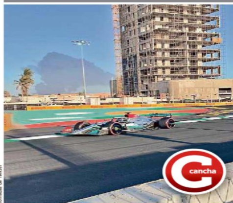
Tomas de Twitter