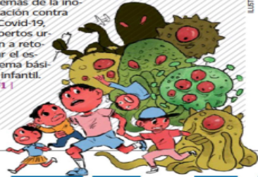
ILUSTRACIÓN: DANTE DE LA VEGA

Además de la inoculación contra el Covid-19, expertos urgen a retomar el esquema básico infantil. | U1 |