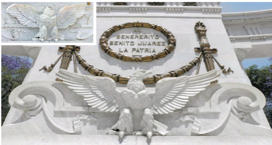
IMAGEN DEL DÍA RESTAURAN HEMICICLO A JUÁREZ

Los daños en el monumento, principalmente en columnas y el águila, durante protestas realizadas en 2019 y 2020 fueron reparados por especialistas del Centro Nacional de Conservación y Registro del Patrimonio Artístico Mueble. Los trabajos para retirar pintas y restaurar piezas con desprendimientos lograron un éxito de 95%; sin embargo, el Hemiciclo sigue cercado con vallas. | CULTURA | A21