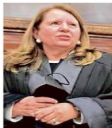
Loretta Ortiz, Ministra de la Suprema Corte de Justicia.

Correspondió a Ortiz elaborar un proyecto con el que propone a sus pares avalar la Ley de la Industria Eléctrica (LIE) aprobada por el Con-