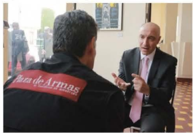
EL DOCTOR MIGUEL CARBONELL en entrevista exclusiva con Plaza de Armas.