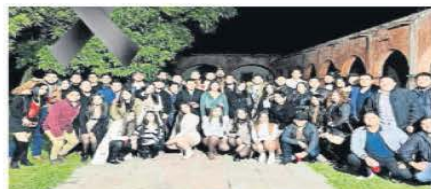
Las víctimas eran jóvenes que celebraban en San José del Carmen.

La Secretaría de Marina informó que ha gastado 64 millones 152 mil 205 pesos en la compra y mantenimiento de drones de 2016 a la fecha. | NACIÓN | A6