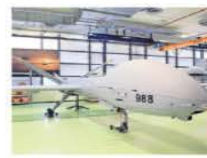
Los drones se usan en misiones de vigilancia y disuasión.

El Estado ha gastado más de 374 millones de pesos en su adquisición y mantenimiento. La Defensa Nacional cuenta con 20 drones entre los que