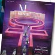
ILUSTRACIÓN: IVAN BARRERA