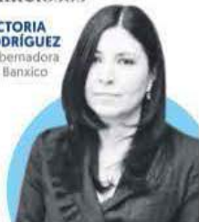
VICTORIA RODRÍGUEZ Gobernadora del Banxico

“Sabemos que aún hay retos. La inflación ha bajado de forma importante, pero necesitamos ser cautelosos”