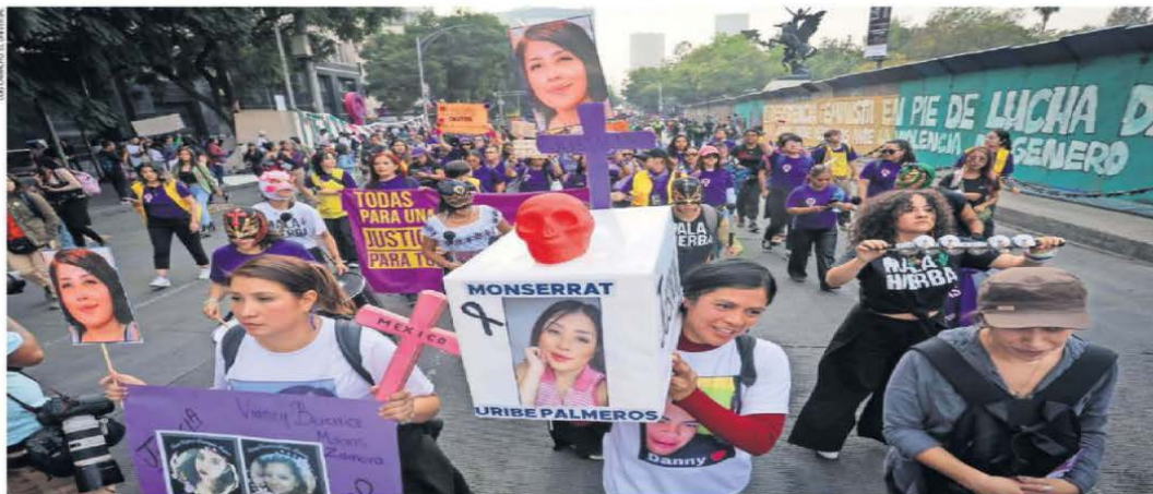
Con cartulinas que llevaban fotografías de víctimas, cientos de mujeres en la CDMX marcharon ayer para exigir justicia ante la violencia y que no haya impunidad.