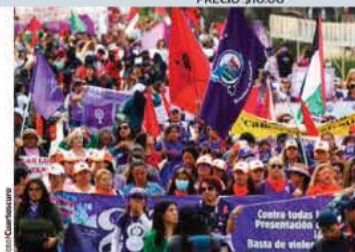
MANIFESTACIÓN de mujeres, ayer, en CDMX.

Se perseguirá de oficio; pena mínima de 15 años de cárcel y multa de $56,700; hay 34 agravantes; por cobro de piso, 33 años; a montachos y montadeudas se aplicará castigo máximo pág. 13