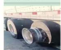
■ Delinquentes robaron las llantas de tráileres, llevados a la protesta.

Líderes transportistas y productores del campo amagaron ayer con ampliar sus protestas en carreteras y aduanas fronterizas, en demanda de seguridad, precios de garantía para el maíz y modificaciones a la Ley de Aguas. Representantes del Frente Nacional para el Rescate del Campo Mexicano y de la Asociación Nacional de Transportistas bloquearon puntos carreteros en más de 10 estados. Mientras estaban reunidos con el Secretario de Agricultura, Julio Berdegué, y con representantes de Segob y Conagua, autoridades federales reprocharon que los bloqueos se mantuvieran y alcanzaron los puentes fronterizos en Ciudad Juárez y Reynosa y el paso en la Grita Mariposa de Nogales. Por ese motivo, las negociaciones estaban entorpecidas anoche en Gobernación y amagaban con reforzar sus protestas. El sector automotriz alertó por afectaciones a la cadena de suministros para plantas en México y EU, debido a los bloqueos de carreteras y aduanas.