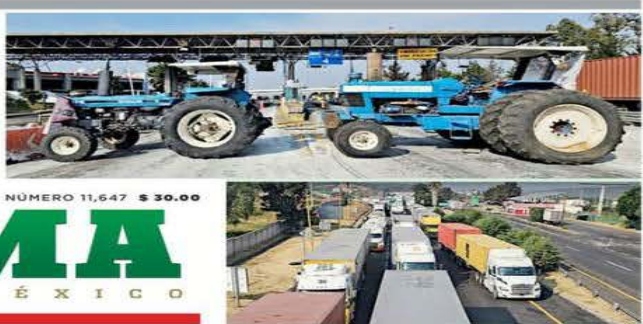
■ Efectos del bloqueo en la caseta de Zinapécuaro.