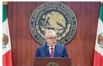
RUBÉN Rocha, ayer, en su 4.º informe.

SALIERON de la pobreza 135,111 sinaloenses, señala el gobernador en su 4.º Informe; reporta economía fortalecida y avance en seguridad. pág. 14