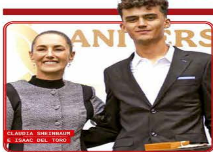
CLAUDIA SHEINBAUM E ISAAC DEL TORO