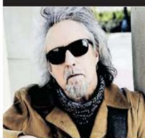
CORTESÍA JOHNNY INDOVINA