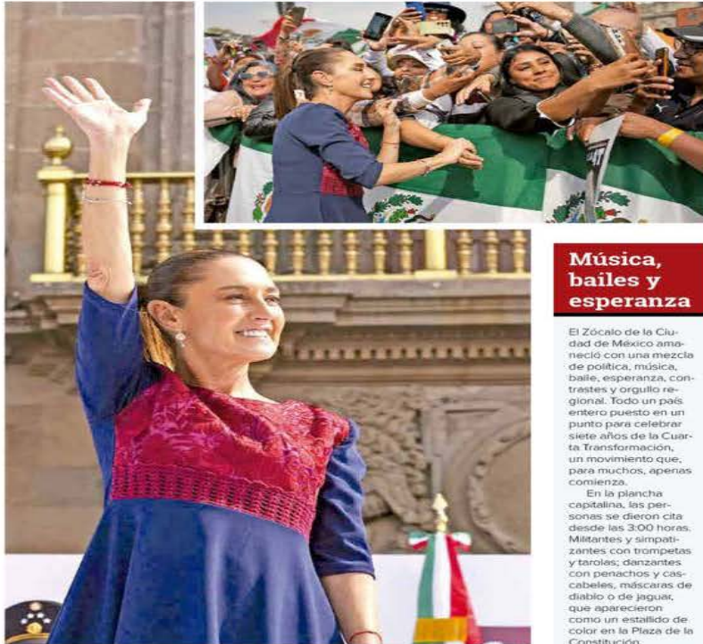
Acompañada por militantes, simpatizantes, su gabinete y gobernadores de la Cuarta Transformación, la titular del Ejecutivo sostuvo que el modelo económico de la 4T funciona y da resultados.

ANTE 600 MIL PERSONAS CONGREGADAS EN EL ZÓCALO CAPITALINO, LA PRESIDENTA DESTACÓ EL AVANCE DE LA CUARTA TRANSFORMACIÓN Y LA BUENA RELACIÓN BILATERAL "PONRIENDO NUESTROS PRINCIPIOS AL FRENTE"