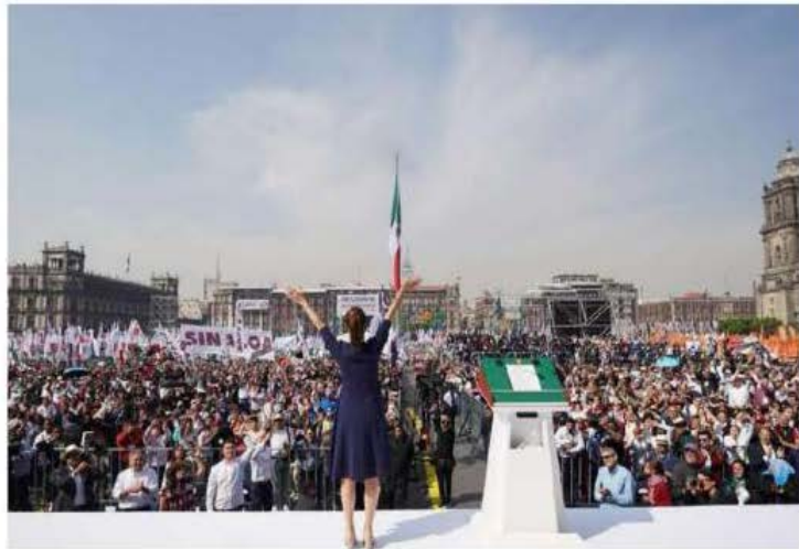
La Presidenta Claudia Sheinbaum estuvo cobijada por una marea humana procedente de varios estados del país que la ovacionó en la plancha del Zócalo de la Ciudad de México, en el marco del séptimo aniversario de la Cuarta Transformación como gobierno.

jo de los siete años de la Cuarta Transformación como gobierno. La Jefa del Ejecutivo Federal también resaltó que además del tema comercial existe un buen entendimiento en materia de seguridad sustentado en cuatro principios: respeto a la soberanía y a la integridad territorial, responsabilidad compartida y diferenciada y colaboración sin subordinación. PAG. 5