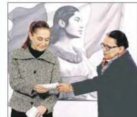
▲ La jefa del Ejecutivo y la secretaria de Gobernación, ayer durante la mañana.

A. VILLASEÑOR, J. LAURELES, A. MUÑOZ Y E. OLIVARES / P 5