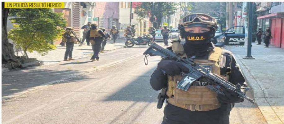
UN POLICÍA RESULTÓ HERIDO