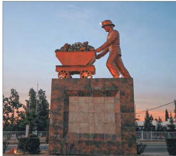
▲ El monumento en Sonora representa la heroica resistencia de los mineros. La solución al conflicto provocado por Grupo México, propiedad de Germán Larrea, forma parte del Plan Integral de Justicia para Cananea, que el gobierno federal dará a conocer próximamente.