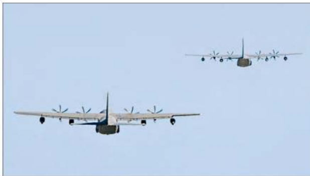
▲ Aviones Hércules de la fuerza aérea estadounidense despegan de un aeropuerto

en Puerto Rico, como parte de la campaña militar desplegada en el Caribe.