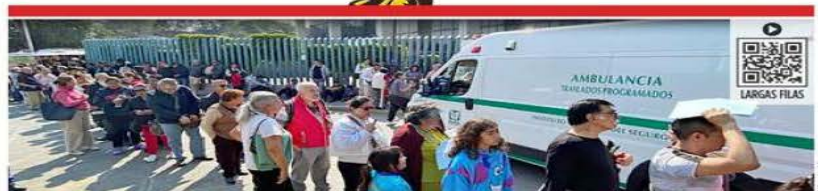
Decenas de pacientes hicieron fila por varias horas el miércoles para poder agendar una cita médica en La Raza.

Piden a paciente con metástasis esperar... ¡meses!