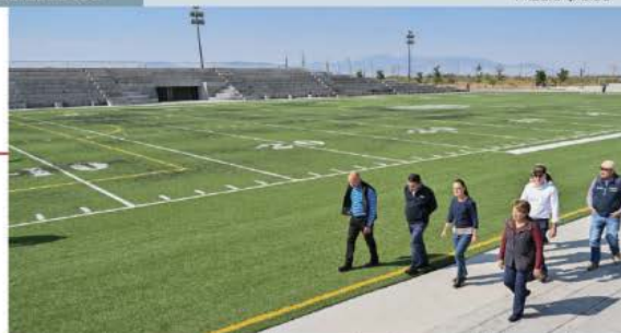
LA PRESIDENTA recorrió, en actividades vespertinas, el Parque Ecológico Lago de Texcoco, acompañada por la gobernadora del Estado de México, Delfina Gómez, ayer.

MANDATARIA destaca que clase media en México creció 12.4%; 4 de cada 10 entra en ese grupo, dice; inversión social aumentó más de 2,000% en últimos 3 sexenios.