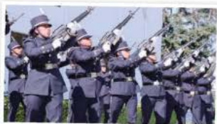
CADETES realizan tiros de salva de honor, ayer.