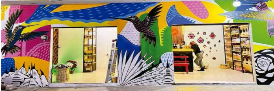
ARTE MURAL EN EL CENTRO HISTÓRICO DE OAXACA