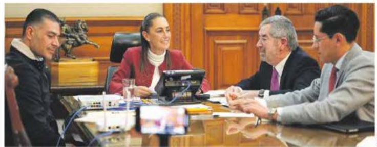
Llamada de 15 minutos. Claudia Sheinbaum aseguró que Donald Trump dijo estar al tanto de los avances en seguridad.

PRI Y PAN. Exigencia de EU sobre resultados contra narco es advertencia; demandas deben ser mutuas. PÁG. 31