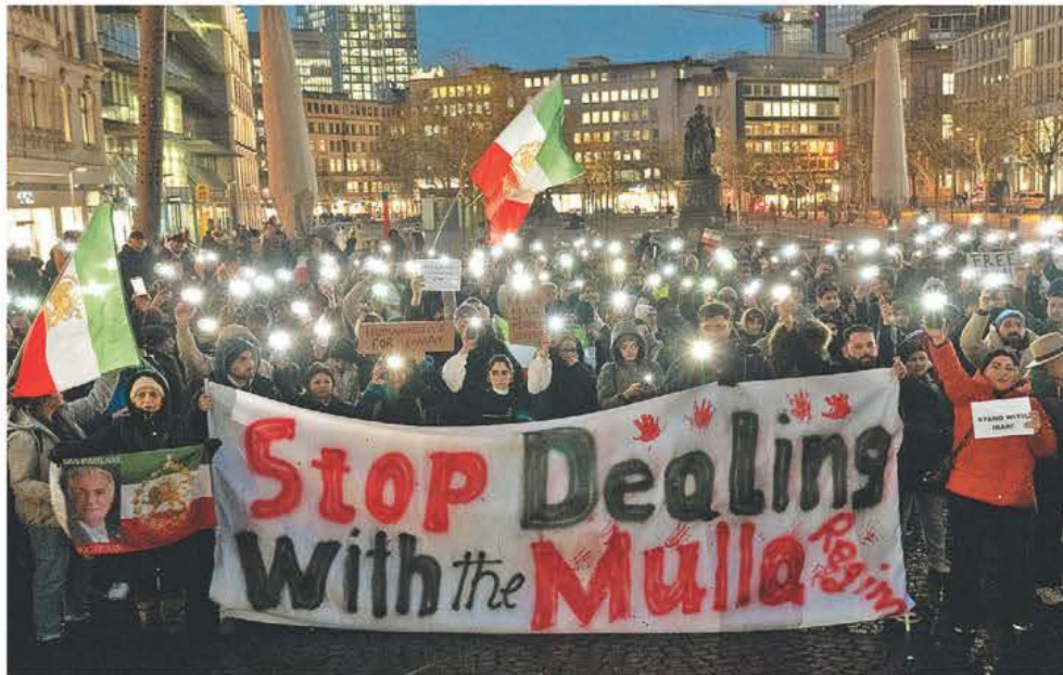
Las protestas contra los mulás se extendieron a Fráncfort y EU anunció aranceles a países que negocien con Irán. PÁG. 6