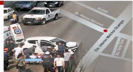
Gráfico: Horacio Sierra

MONREAL ABRE AL INE LAS PUERTAS DEL CONGRESO