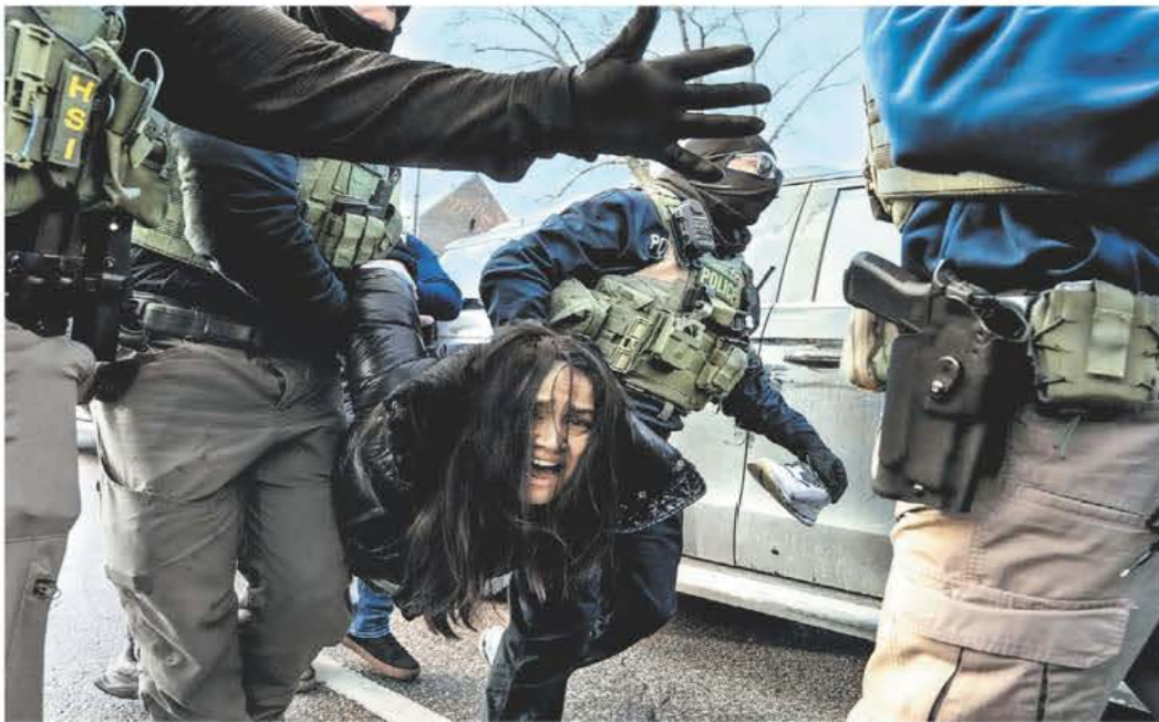
La Casa Blanca anunció recortes a las ciudades santuario mientras se intensifica la represión en Minneapolis.

Irene Vallejo "Entre el castigo infernal a Sísifo y un campo de exterminio" - P. 25