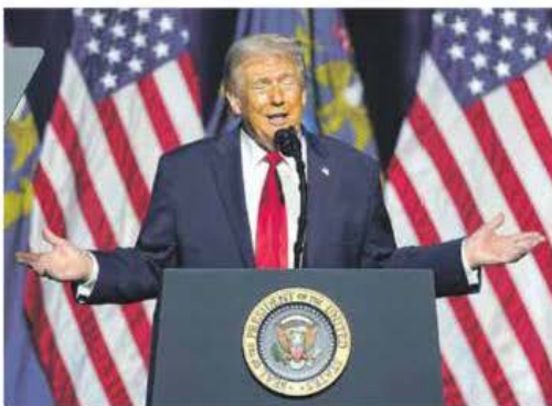
Mensaje en Detroit. 'GM está trasladando producción desde México a EU.'

"Ni siquiera pienso en el T-MEC. Quiero que a Canadá y a México les vaya bien, pero no necesitamos sus productos. No necesitamos autos hechos en Canadá. No necesitamos autos hechos en México. Queremos fabricarlos aquí", dijo. —Bloomberg / J. Valdelamar / PÁG. 4