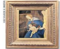
Se confirmó que La Sagrada Familia, en este museo, sí es de Botticelli.