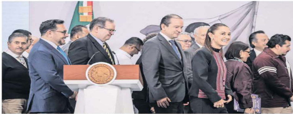
La presidenta Sheinbaum, junto al grupo de especialistas en el tema de extracción de gas no convencional en la conferencia mañanera.

Evaluará la viabilidad de explotación con el menor impacto ambiental