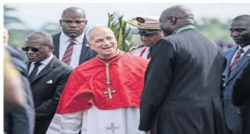
El papa León XIV, a su llegada al Aeropuerto Internacional de Yaoundé, en Camerún.

● Roma. — El papa León XIV no quería ser absorbido por el trumpismo, pero la guerra y lo que ha generado el presidente de Estados Unidos en el mundo no le dejó más opción que alzar la voz. "Es un león que ha sacado las garras", asegura el teólogo e historiador Massimo Faggioli. Las críticas de Trump, dice, pueden costarle caro. ● Mundo A12