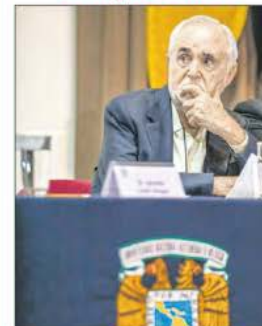
▲ A sus 95 años, el historiador, renovador de las ciencias sociales en México y mentor de generaciones recibió ayer un tributo de las facultades de Economía y de Filosofía y Letras de la UNAM, que inauguraron un congreso en su honor. ÁNGEL VARGAS Y LILIAN HERNÁNDEZ / CULTURA