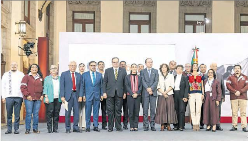
▲ La jefa del Ejecutivo dedicó su conferencia mañanera de ayer a la presentación del comité de especialistas que evaluará la viabilidad de la fractura hidráulica como mecanismo para la extracción de gas natural. Entre los asistentes estuvieron