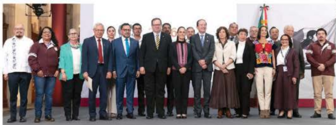
LA MANDATARIA, ayer, con parte del equipo que dará su opinión sobre el fracking.

Grupo multidisciplinario, en el que hay opositores a esta forma de extracción, evaluará viabilidad; también considerará opinión de comunidades; iniciará en Coahuila