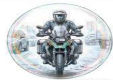
Ilustración: Jesús Sánchez

Legisladores y activistas buscan un consenso para garantizar seguridad, cascos certificados y frenar señalamientos contra motociclistas. / 8