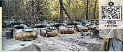
Cientos de cilindros de gas y 19 hornos para cocinar drogas conformaban un complejo de narcolaboratorios en Chihuahua.

El Gobierno de Chihuahua insistió en la versión de que los estadounidenses "estaban en trabajos de capacitación bilateral normal y de una relación habitual entre el Gobierno de EU y México".