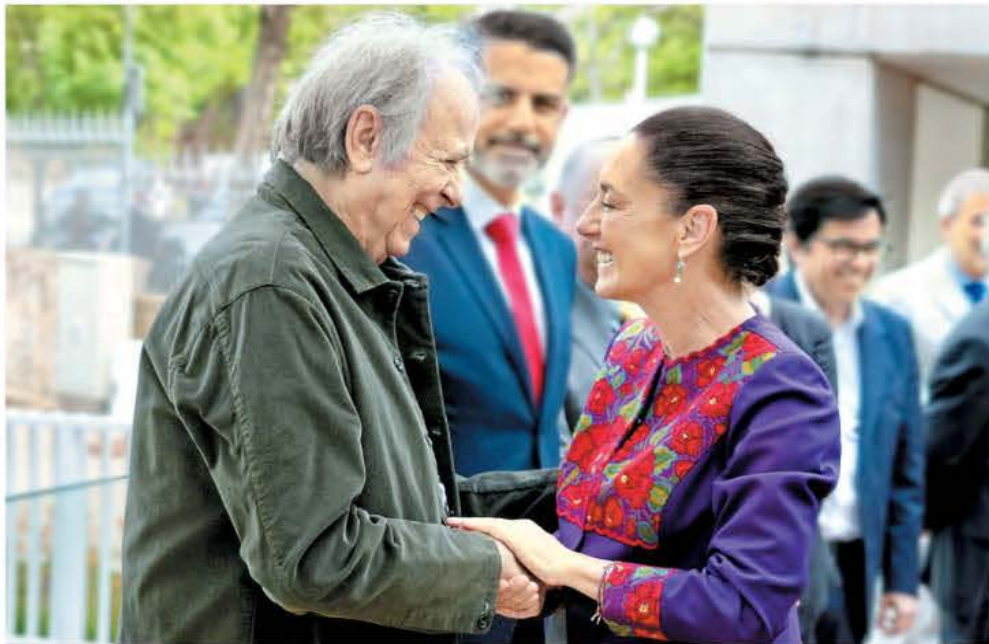
El cantautor catalán retirado y la titular del Ejecutivo en el Centro Nacional de Supercómputo en Barcelona.

Reporte del Inegi Se incrementó 61% precio de la tortilla en siete años FERNANDA MURILLO - PAG. 21