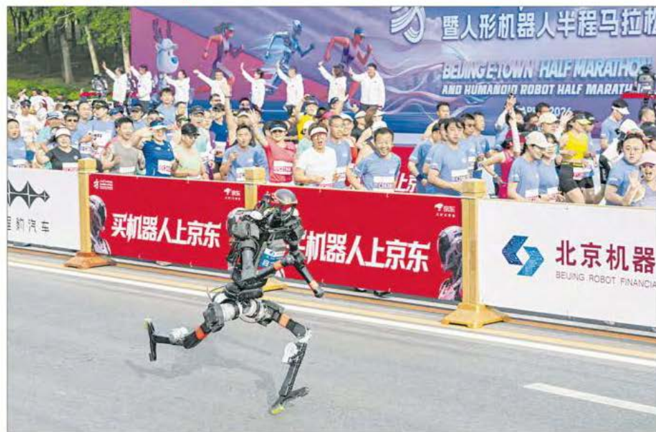
▲ Un robot que ganó el medio maratón en Pekín, en el que también participaron humanos, fue más rápido que el ugandés Jacob Kiplimo, poseedor del récord mundial. El triunfador, de Honor, un fabricante