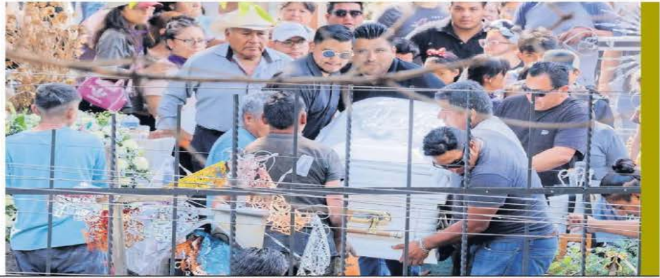
OSCAR ALONSO/EL UNIVERSAL