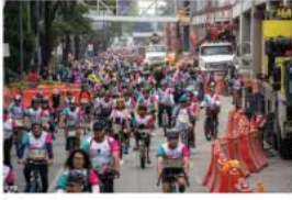
Cientos recorrieron ayer la ciclovía de la Gran Tenochtitlán.