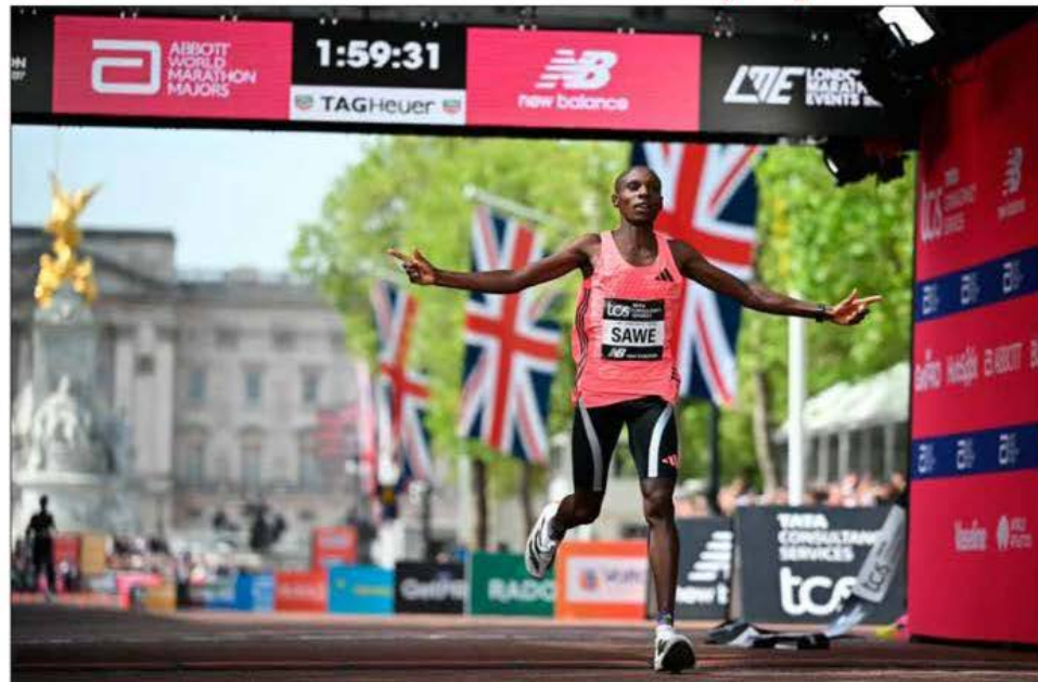
▲ El keniano Sebastian Sawe ganó el Maratón de Londres con tiempo de 1:59:30 y mejoró la anterior marca mundial por 65 segundos. También el etíope Yomif Kejelcha, con 1:59:41, hizo la hazaña en una competencia oficial. En la rama femenil, la etíope Tigst Assefa rompió su propio récord del orbe con 2:15:41. Participaron 59 mil corredores. Foto Alp REDACCIÓN / DEPORTES