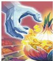
Ilustración: Erik Retana

La llegada de la ciclorfina, un opioide 10 veces más potente que el fentanilo y vinculado ya a 16 muertes en Tennessee, prende focos rojos, principalmente en Estados Unidos. / 15