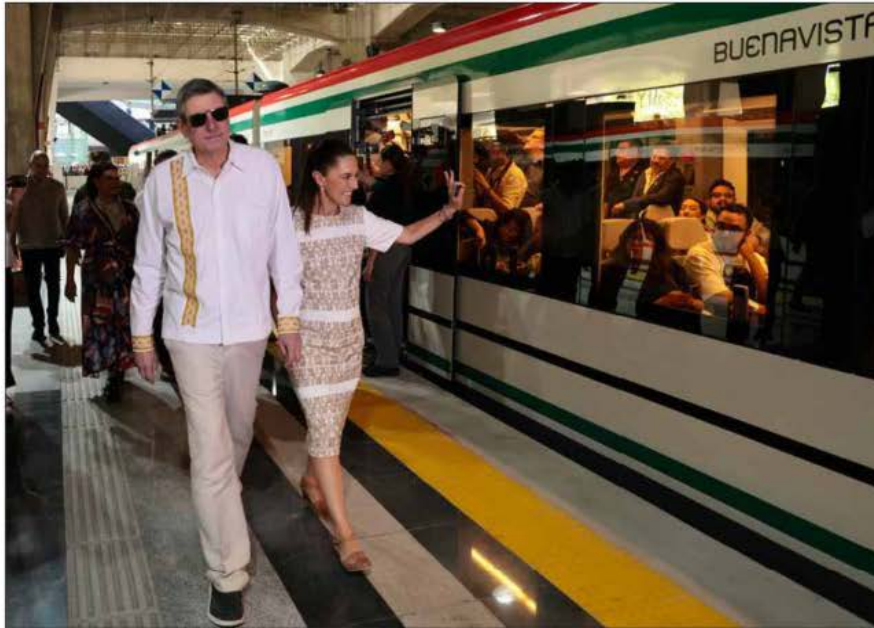
▲ "Misión cumplida", expresó la presidenta Claudia Sheinbaum al poner en operación el Tren Suburbano que conecta de forma directa y rápida al Aeropuerto Internacional Felipe Ángeles con